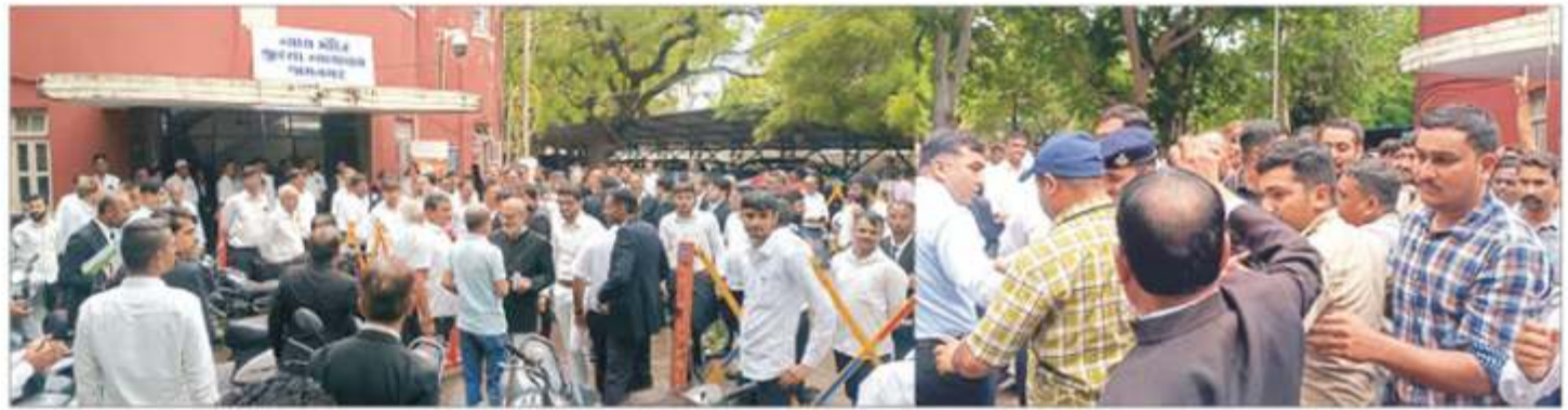
મૂળ ગુન્હામાં ધરપકડના બદલે પહેલા લેવાયું અટકાયતી પગલું: