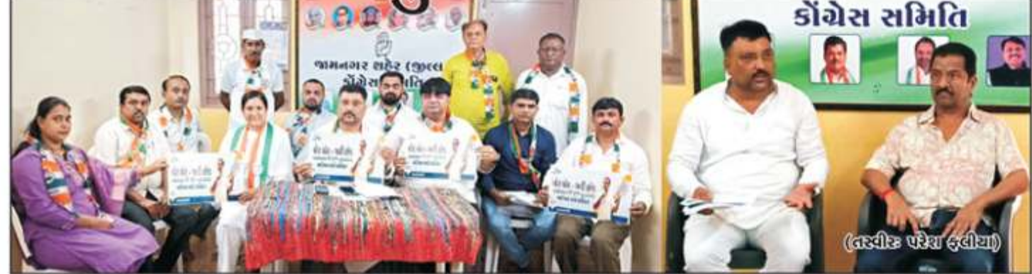
કોંગ્રેસ સમિતિ

જામનગર તા. ૨: રણનીતિ સાથે દેશવ્યાપી કોંગ્રેસના સાંસદ અને રાષ્ટ્રીય નેતા રાહુલ ગાંધીએ મહારાષ્ટ્ર રાજ્યની વિધાનસભાની ચૂંટણી પછી મતદાર યાદીમાં ચૂંટણી પંચ દ્વારા થઈ રહેલી ગોબાચારીનો આધાર-પુરાવા સાથે પર્દાફાલ કર્યો છે. મતદાર યાદીમાં અને દેશમાં ચૂંટણીઓમાં ચાલી રહેલી વ્યાપક ગેરરીતિઓ સામેની લડતને દેશવ્યાપી બનાવવા 'વોટ ચોર, ગાદી છોડ'ના નારા સાથે અહીં ચૂંટણી શરૂ કરવામાં આવી છે. કોંગ્રેસ પક્ષની આ અતિ ગંભીર બાબત અંગે આક્રમક