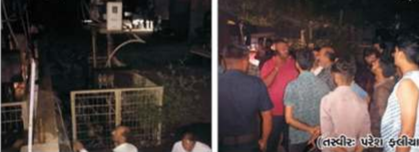
જામનગરના સાધના કોલોની વિસ્તારમાં આવેલા મુખ્યમંત્રી આવાસ નજીકના વીજ કંપનીના ટ્રાન્સફોર્મરમાં ગઈરાતે કોઈ રીતે ઘડાકા પછી આગનું છમકવું થયું હતું. વીજળી ગુલ થઈ ગઈ હતી. ઘોડી આવેલી વીજ કંપનીની ટૂકડી અને ફાયરફાઈટરોએ કાર્યવાહી હાથ ધરી હતી.