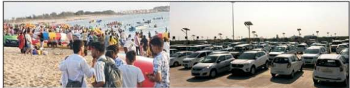
દ્વારકામાં તમામ હોટલ, ગેસ્ટ હાઉસ, ભવન હાઉસફૂલ