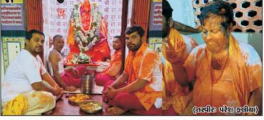
જામનગરના નાનકપુરી સ્થિત ફૂલીયા હનુમાન મંદિરમાં દર વર્ષની જેમ આજે સવારે હનુમાન જન્મોત્સવ નિમિત્તે પાંચ વાગ્યે ઘૂલ ચોળવામાં આવી હતી તે પછી પૂજારીજીએ સંદેહની પ્યાલીમાંથી પ્રેતાદી લીધી હતી અને ભાવિકોએ ભાવભેર હનુમાનજીના દર્શન કર્યા હતા. આજે સાંજે મહોરમારતી અને બટક ભોજન વગેરે ધાર્મિક કાર્યક્રમો યોજાયા છે. હનુમાનજીના સ્વયંભૂ પ્રાગટ્યનું આ એક અનોખું પવિત્ર સ્થળ છે તેવી માન્યતા છે.