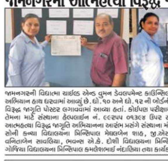
જાનનગરની વિદ્યાલયા ચાઈલ્ડ એન્ડ યુવન ડેવલપમેન્ટ કાઉન્સિલ દ્વારા આત્મહત્યા વિરૂદ્ધ જાગૃતિ અભિયાન હાથ ધરવામાં આવ્યું છે. ધો. ૧૦ અને ધો. ૧૨ ની બોર્ડની પરીક્ષાના કેન્દ્રો ઉપર આત્મહત્યા વિરૂદ્ધ જાગૃતિ પોસ્ટર લગાવવામાં આવ્યા હતાં. કોઈપણ પરીક્ષાર્થી હતાશો કે મુંઝવણ અનુભવે તો તેમના માટે સંસ્થાના હેલ્પલાઈન નં. ૯૯૨૫૫ ૦૨૩૯૪ ઉપર સંપર્ક કરવા અનુરોધ કરાયો છે.