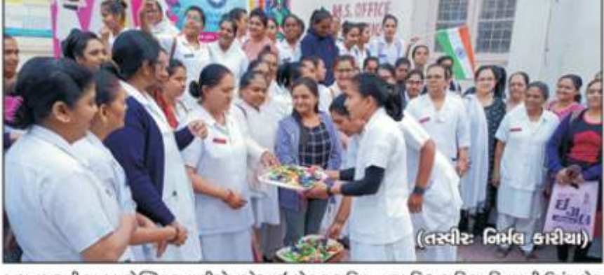
જાનગરની જી.જી. હોસ્પિટલના ટીએનએઆઈ લોકલ યુનિટ દ્વારા વિશ્વ મહિલા દિવસની ઉમંગભરે ઉજવણી કરવામાં આવી હતી.