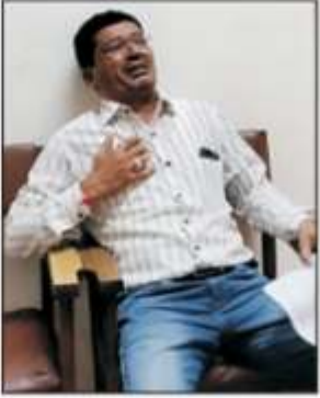
આ પછી તેઓ ત્યાંજ ઢળી પડ્યા પછી ૧૦૮ એમ્બ્યુલન્સ મારફત તેને સારવાર માટે હોસ્પિટલમાં ખસેડવામાં આવ્યો હતો.

જામનગર તા. ૨૭: જામનગર મહાનગરપાલિકાના કમિશનર કાર્યાલયમાં ફરજ બજાવતા પટાવાળાએ ગઈકાલે સ્ટેન્ડીંગ કમિટીના ચેરમેનની ચેમ્બરની બહાર જ કોઈ એરી પ્રવાહી પી લેતા સારવાર માટે હોસ્પિટલમાં દાખલ કરવામાં આવ્યો હતો જ્યાં તેણે ચેરમેન સામે ગંભીર આલેપો કર્યા હતાં. બીજી તરફ ચેરમેન દ્વારા પણ પોતાના વિશે એલકેલ બોલવા અને ગાળાગાળી કરી ધમકી આપવા અને પટાવાળા વિરુદ્ધ પોલીસમાં અરજી આપી હતી, અને આગામી દિવસે જ પટાવાળાની બદલી થતા ગઈકાલે તેણે આપઘાતનો પ્રયાસ કરતા ચક્રવાર જાગી છે.