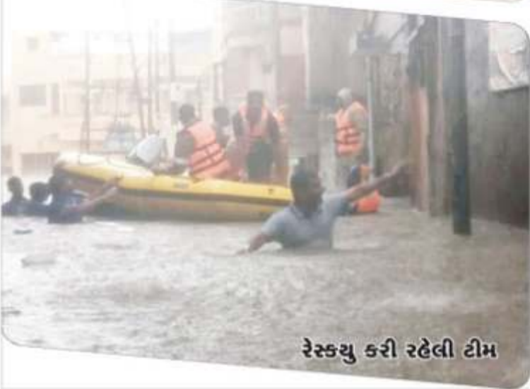
રેસ્ક્યુ કરી રહેલી ટીમ