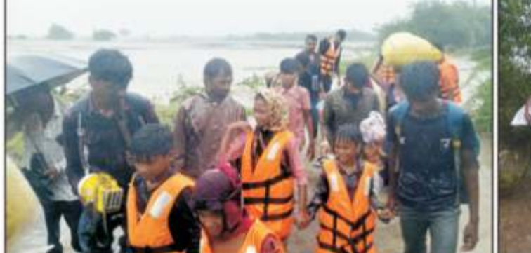
જામનગર તા. ૨૯: જામનગર જિલ્લાના બાલંભા ગામે પાણીના પ્રવાહમાં ફસાયેલા ૮૩ લોકોને એસડીઆરએફની ટીમ દ્વારા દિલદડક રેસ્ક્યુ ઓપરેશન દ્વારા બચાવવામાં આવ્યું હતું. તંત્રની સત્કાર્યના પરિણામે વાડી વિસ્તારમાં ફસાયેલા ૨૮ બાળકો સહિત તમામ