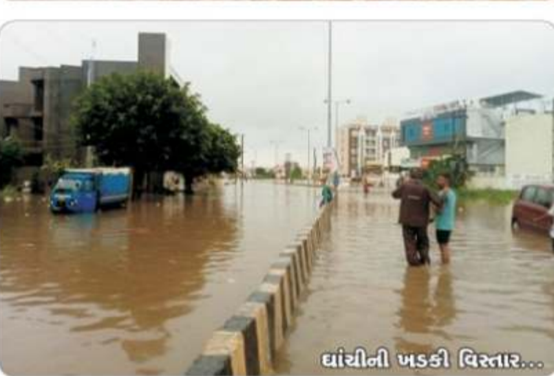
ધાંચીની ખડકી વિસ્તાર...