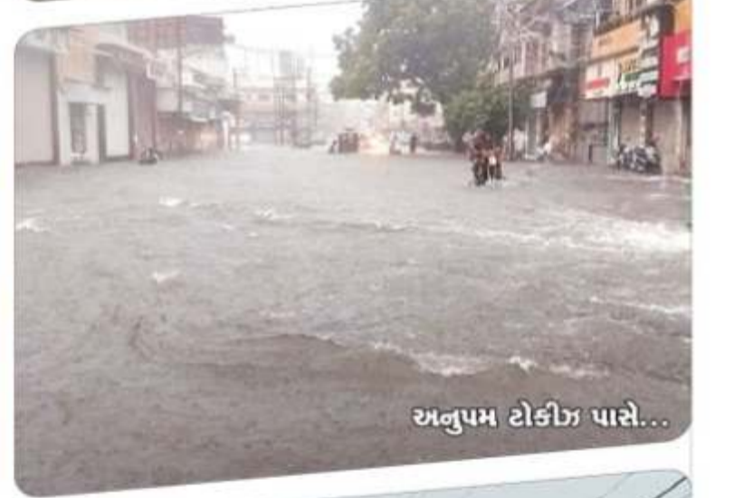
અનુપમ ટોડીજ પાસે...