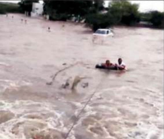
સહારે જીવના જોખમે રેસ્ક્યુ ટીમ મેમ્બર્સ દ્વારા કલ્પેશભાઈ વસઈ ગામમાંથી જામનગર તરફ જતા રોડ તરફ પાણીના ધસમસતા પ્રવાહમાં સ્વીફ્ટ ગાડીમાં બે માણસ તથા ગામ જનારની મદદથી ધસમસતા પાણીમાં દોરડાના

જામનગર તા. ૨૯: જામનગરમાં સતત વરસાદ વરસી રહ્યો છે ત્યારે અનેક જગ્યાઓ પર જિલ્લા વહીવટી તંત્રના માર્ગદર્શન હેઠળ સતત બચાવ કામગીરી કરવામાં આવી રહી છે. જામનગરમાં વસઈ ગામથી આગળ હારકા તરફ જતા રોડ તરફ પાણીના ધસમસતા પ્રવાહમાં સ્વીફ્ટ ગાડીમાં બે માણસ તથા ગામ જનારની મદદથી ધસમસતા પાણીમાં દોરડાના