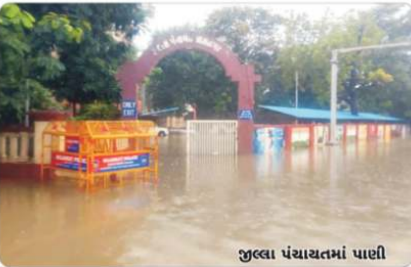
જુલવા પંચાયતમાં પાછી