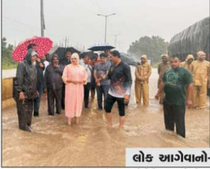
લોક આગેવાનો-અગ્રણીઓ જોડાયા