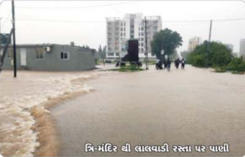
ત્રિ-મંદિર યી લાલવાડી રસ્તા પર પાછી