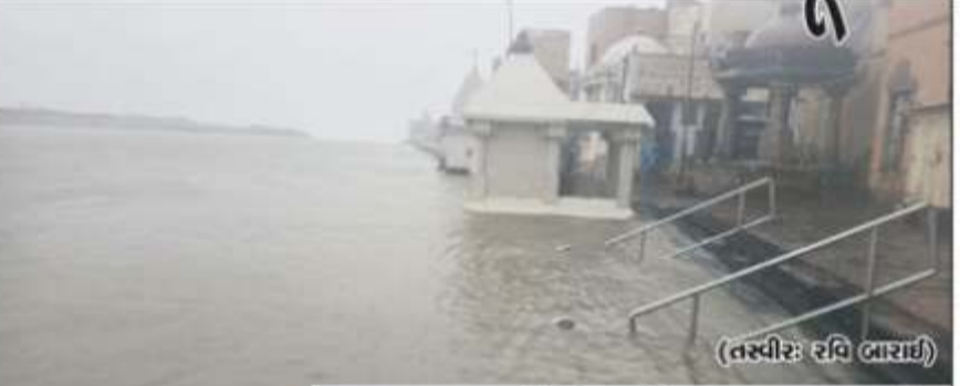
દારકા તાલુકામાં મોસમનો ફુલ વરસાદ ૮૦ ઈંચ (તસ્વીર: રવિ બારાઈ)

દારકા તા. ૨૯: દારકા શહેર તથા તાલુકામાં છેલ્લા ત્રણ દિવસમાં અવિરત અને ભારે વરસાદ પડતાં ઘણે તરફ પાણી-પાણી થઈ ગયું હતું. દારકા શહેરના મોટાભાગના માર્ગો પર ગોઠવવાથી વધુ પાણી ભરાઈ જતાં લોકો અને વાહનચાલકો ભારે મુશ્કેલીમાં મુકાઈ ગયા હતાં. દારકાના દરિયામાં જબરદસ્ત કરન્ટ સાથે ભરતી આવી હતી અને ઉંચા મોજા ઉછળ્યા હતાં. દરિયામાં ભરતી અને ગોમતી નદીમાં પૂરના કારણે ગોમતી નદીના પાણી શહેરમાં ધૂસી ગયા હતાં. ગોમતીઘાટના ૧૩ જુના ઘાટ અને પાંચ નવા ઘાટ મળી તમામ ૧૮ ઘાટ પાણીમાં ગરકાવ થઈ ગયા હતાં. મહાપ્રભુજી ગોમતીઘાટ ઉપર પણ પાણી ફરી વળ્યા હતાં. ઘાટ ઉપર આવેલા શિવમંદિરો, મહાપ્રભુજી બેઠક, ગોમતી માતાનું મંદિર તેમજ અન્ય મંદિરોમાં અને પરિસરમાં પાણી ધૂસી જતાં મંદિરોમાં સેવા-પૂજાના કમમાં વિલેપ પડ્યો હતો. શહેરના માર્ગો પર પાણી-પાણી દારકા શહેરના ઈસ્કોન ગેઈટ, રબારી ગેઈટ, ધનશ્યામ નગર, રેલવે સ્ટેશન વિસ્તાર વગેરેના મુખ્ય માર્ગોમાં પાણી ભરાઈ જવાથી વાહન વ્યવહાર તથા લોકોની અવરજવર કામ થઈ ગયા હતાં. જન્માષ્ટમી ઉત્સવમાં દારકામાં ઈશનાચંદ્ર આવેલા બહારગામના યાત્રિકોને ભારે વરસાદના કારણે ફરજિયાત દારકામાં રોકાણ કરવું પડ્યું છે. રોજેરોજનું કમાનાર વર્ગના લોકોની રોજેરોડીને પણ ગંભીર અસર થઈ છે. સુદામા સેતુ તથા વીજનગર અંબાળી માર્ગ ઉપર આવેલી દુકાનો, રેસ્ટોરેન્ટો, હોટલોમાં પાણી ધૂસી ગયા હતાં. દરિયામાં ફસાયેલા માચીમારોનું રેસ્કયુ દારકા નજીકના દરિયામાં એક માચીમારી બોટ પરત