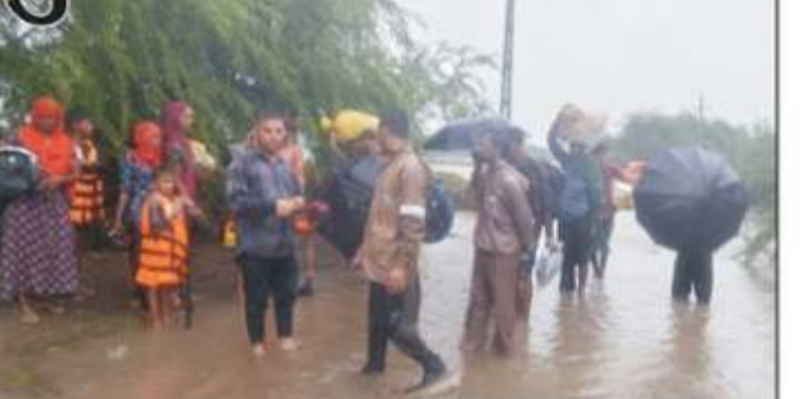
જામનગર તા. ૨૯: જામનગર જિલ્લાના બાલંભા ગામે પાણીના પ્રવાહમાં ફસાયેલા ૮૩ લોકોને એસડીઆરએફની ટીમ દ્વારા દિલદડક રેસ્ક્યુ ઓપરેશન દ્વારા બચાવવામાં આવ્યું હતું. તંત્રની સત્કાર્યના પરિણામે વાડી વિસ્તારમાં ફસાયેલા ૨૮ બાળકો સહિત તમામ