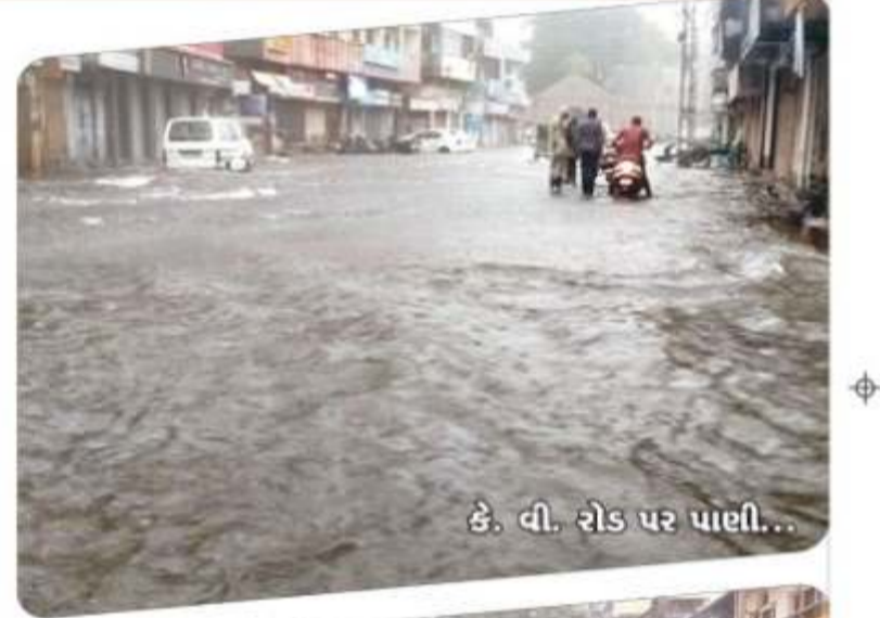
કે. વી. રોડ પર પાછી...