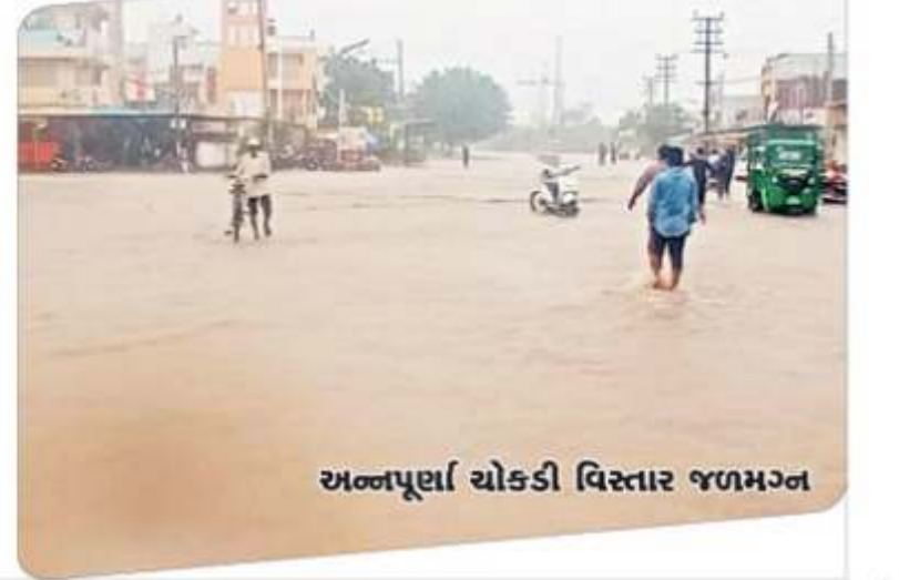
અન્નપૂર્ણા ચોકડી વિસ્તાર જળમગ્ન