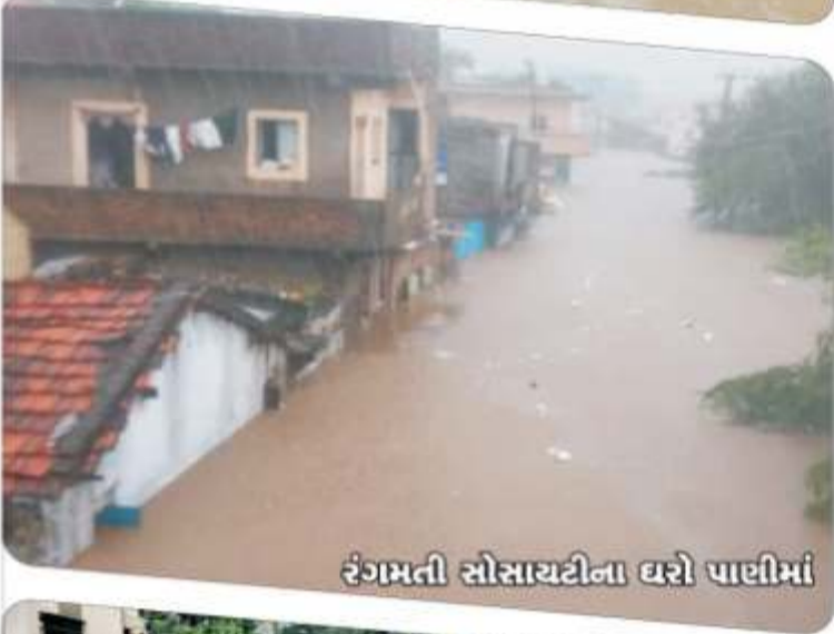
રંગમતી સોસાયટીના ઘરો પાછીમાં