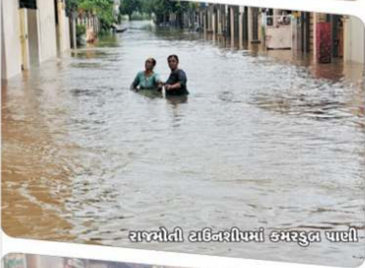
રાજમોતી વાહિનશીપમાં કમરડુલ પાછી