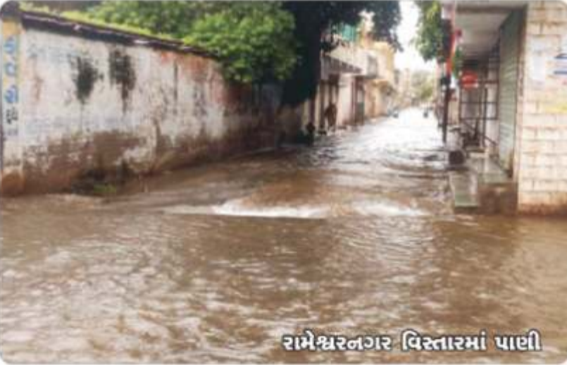
રામેશ્વરનગર વિસ્તારમાં પાછી