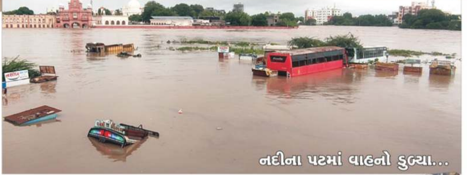
નદીના પટમાં વાહનો ડુબ્યા...